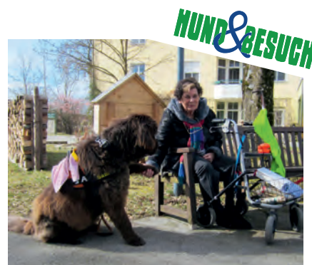
Für alte Menschen ist der Hund oft ein Tor in ihre Erinnerungen

Die 26 ehrenamtlichen Mitglieder des gemeinnützigen Vereins „Hund & Besuch“ bringen seit 2014 mit ihren Hunden Motivation, Spaß und Abwechslung in den Alltag verschiedener Hilfsbedürftiger. Vor ihrem „Einsatz“ absolvieren die Hunde übrigens eine Verhaltensüberprüfung, so dass es keine unangenehmen Überraschungen